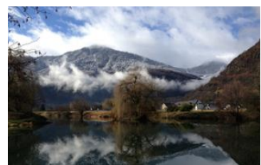
Mairie de Luchon