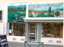
12 La Canarderie à Toulouse : du canard plein les fêtes !