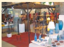
36 Succès des III es Artisanales du Comminges