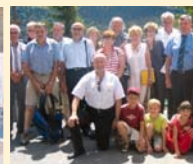
42 La station de ski de Peyragudes accueille l'AG d'Acti'31

de nouveaux produits pour les artisans 27 DOSSIER : préparez votre transmission, donnez de la valeur à votre entreprise 32 DOSSIER :