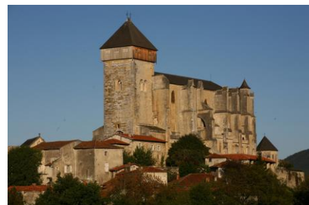
Saint-Bertrand de Comminges