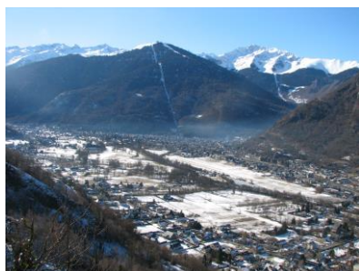
Bagnères de Luchon